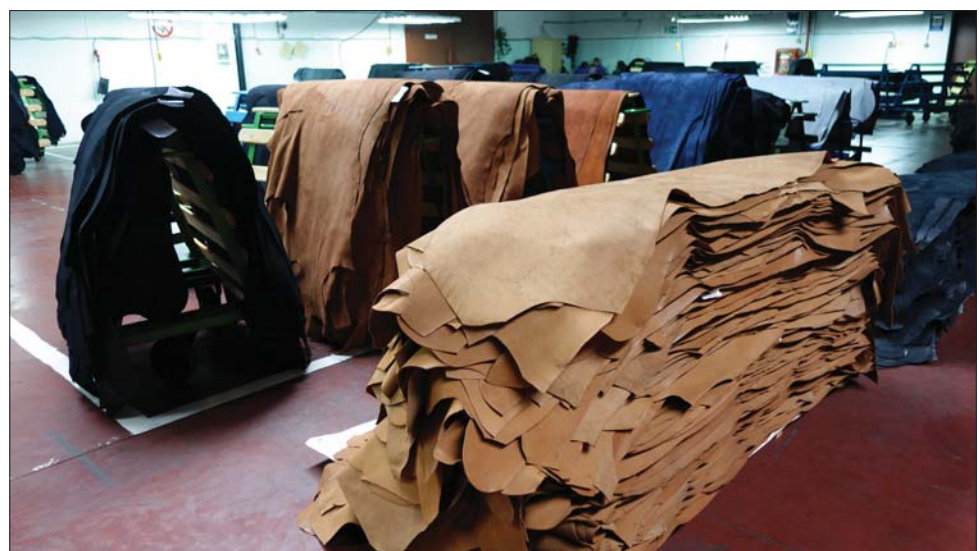
Готовая продукция в ожидании отправки потребителям