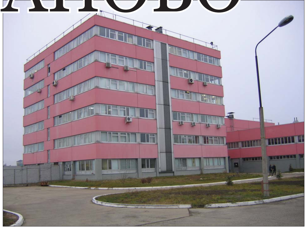
Административное здание предприятия

ОАО «Минское производственное кожевенное объединение» 223017 Минская область, Минский район, р-н аг. Гатово Тел: 503-61-60, факс: 503-31-06 Отдел маркетинга: 503-31-01, 503-31-03, факс: 503-36-69 Производственно-технический отдел: 503-36-90 Эл. почта: info@mpko.by; market@mpko.by Сайт: www.mpko.by