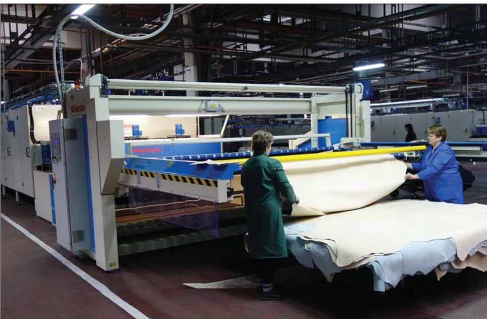
Новая линия покрывного крашения фирмы «GEMATA» — гордость предприятия